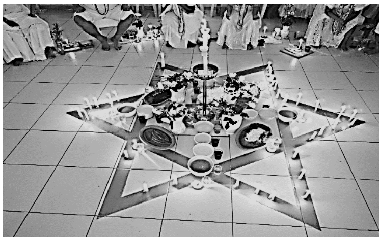
Senzala de Preces para Desencarnados.