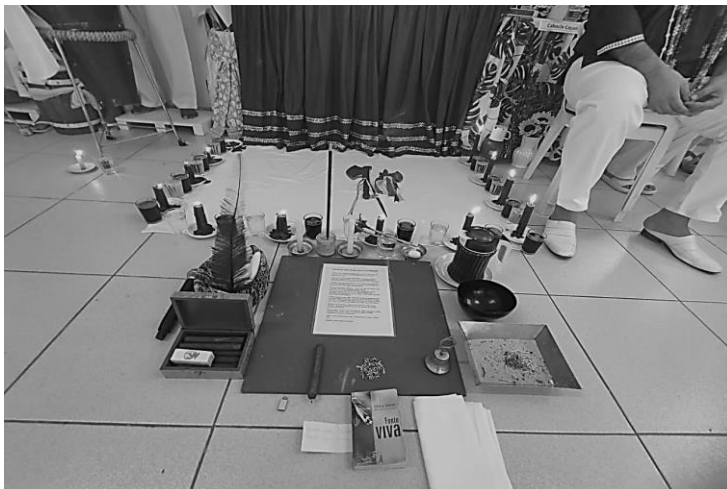
Homenagem a Xangô.