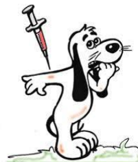
Eles também devem ser vacinados.

A vacina que garante a imunização contra o sarampo, a caxumba e a rubéola é de extrema importância e deve ser tomada durante a infância, época em que o risco de contração é maior. Mulheres e gestantes devem prestar atenção redobrada para o caso de não terem tomado a vacina na infância, pois a rubéola causa grandes problemas e riscos durante a gravidez.