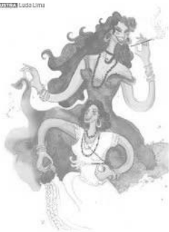
ILUSTRAÇÃO: Lucio Lima

Foram homens e mulheres das mais variadas profissões.