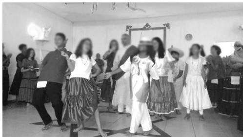
Exú, Pombagira e Malandro