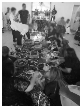
Homenagem a Exús e Pombagiras Agradecemos as colaborações.