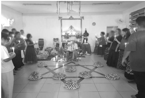
Trezena de Santo Antônio Vovô Samuel da Bahia