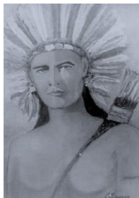
Caboclo das Sete Encruzilhadas