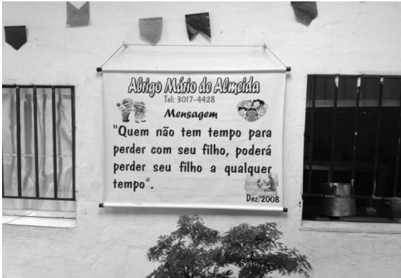
Entrega dos donativos arrecadados pela campanha do cobertor.