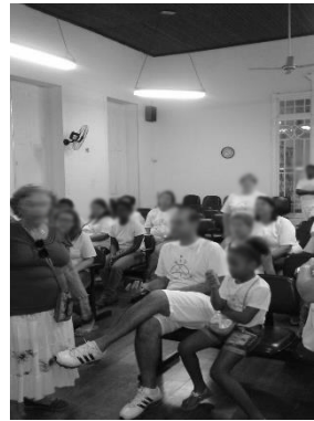
Sala de Palestras