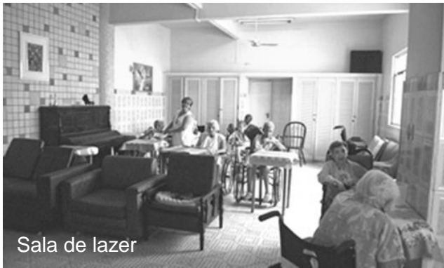
Sala de lazer